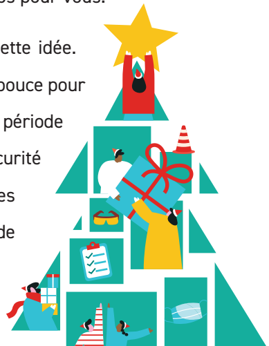
Illustration : Patricia Gagnon

Découvrez des astuces qui vous donneront un petit coup de pouce pour améliorer vos méthodes de travail avec les poupons. En cette période hivernale, si vous désirez faire quelques rappels sur la sécurité routière, vous trouverez entre ces pages une synthèse des bonnes pratiques. Vous aimeriez un outil pour faire un bilan de vos actions en prévention ? Allez en fin de numéro, l'ASSTSAS l'a conçu pour vous ! Bonne lecture et bonne année 2026 !