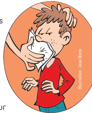
Illustration : Jean Morn

En collaboration avec les travailleuses, la direction utilisera différents outils pour déterminer les risques. Pensons au registre des accidents et incidents, à l'inventaire des produits et des équipements, aux inspections, aux sondages sur les besoins et difficultés.