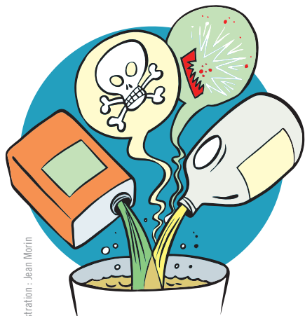
Illustration : Jean Morin