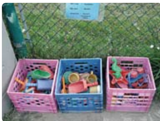
Dans la cour, des bacs facilitent le rangement rapide après l'activité.

En 2006, seulement pour les éducatrices, les sommes associées aux indemnités pour les chutes représentent plus d'un million de dollars !