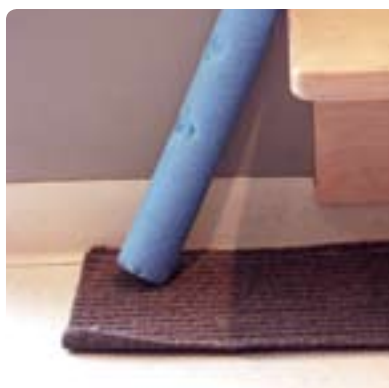
Un coin de tapis qui retrousse présente un risque de trébucher.

Pour éviter les chutes, gardez les planchers propres et secs, enlevez les jouets des zones de circulation. Utilisez des équipements stables et entretenez bien les aires extérieures. En plus, parlez-en lors des réunions. Agissez, si vous constatez la présence d'un risque. Demeurez aux aguets, une chute est si vite arrivée !