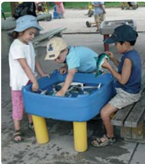
Enfants, jouets, eau, sable et dénivellation entre les zones de jeu entraînent aussi des risques de chute.

→ Contenir les jouets dans une zone spécifique et délimitée par un tapis ou, encore, par des modules séparateurs pour créer un coin thématique. Cet aménagement invite les en-