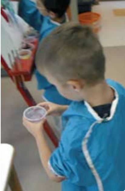
Gare au plancher mouillé !

éviter les replis. Les dessous caoutchoutés sont à privilégier. Certains services de garde misent sur un plancher chauffant au vestiaire pour éliminer les tapis et réduire l'entretien.