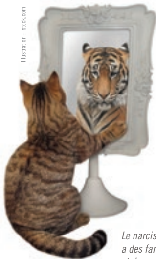
Le narcissique mégalomane a des fantasmes de grandeur et de succès.

Ce profil a un besoin excessif d'être admiré. Il réclame une attention constante qui l'amène à tout faire pour devenir le point de mire. Dans sa dimension positive, ce profil peut générer de grands créateurs, mais ils sont égocentriques. Quand les choses ne vont pas comme il veut, ce profil accuse tout le monde – sauf lui. Vous ne l'entendrez jamais dire qu'il s'est trompé ; c'est le système, la direction de l'hôpital, le monde entier qui lui sont hostiles et qui ne reconnaissent pas ses qualités exceptionnelles.