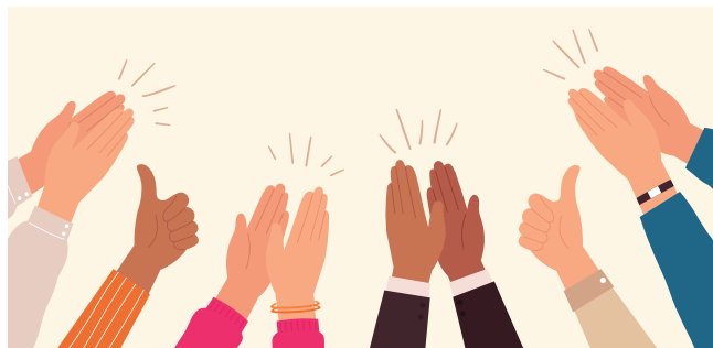
Le narcissique vulnérable accorde une importance exagérée à la reconnaissance.

Il a en commun avec le profil du « grandiose » des fantasmes de réussite et de succès. Il accorde une importance exagérée à la reconnaissance. Il est hypersensible à la critique, dépendant du regard des autres et de la valorisation extérieure. Chez ce profil, la présence d'émotions négatives domine (honte, doute face à ses capacités). Face à une situation difficile pour son ego, il aura tendance à avoir des réactions dépressives ou, si l'humiliation est trop grande, il peut chercher à se venger. Se sentant comme une « coquille vide », il déploie beaucoup d'énergie pour éviter que les autres ne s'en rendent compte. La plupart du temps, cette personne travaille très fort pour être reconnue.