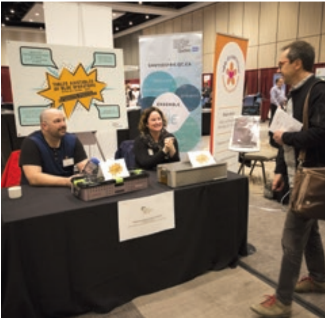
Le kiosque de l'équipe de l'hôpital Fleurimont (CHUS-CIUSSS de l'Estrie), gagnante du Prix du public Pleins feux sur l'initiative en SST.

Pour cette 11 e édition du concours, l'ASSTSAS a présenté dans le salon des exposants les sept projets gagnants réalisés par les établissements et leur équipe de travail. Les participants du colloque étaient également conviés à voter pour le Prix du public. Pour découvrir tous les projets soumis au jury, consultez l'article dans ce dossier ( voir p. 26 ) ou notre site Internet, section Événements.