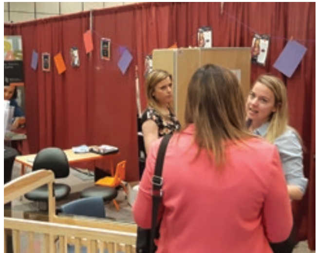
La zone dédiée aux services de garde dans le salon des exposants.

1. Pour consulter la liste des exposants, allez sur notre site ( asstsas.qc.ca ) dans la section Événements, puis sélectionnez le Colloque ASSTSAS 2019 et cliquez sur l'onglet exposants.