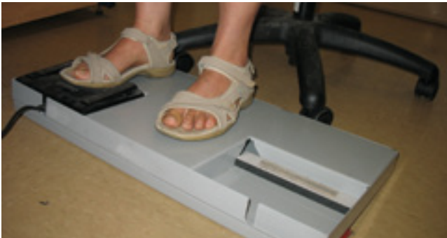
Le nouveau support : modèle court et modèle long. Pour actionner la pédale, celle-ci doit être plus haute que le support. Une bande de 2 cm de hauteur est fixée à l'avant de l'insertion pour assurer la hauteur requise.

Une travailleuse qui ressentait des douleurs au genou droit depuis plus de dix ans actionne maintenant la pédale avec son pied gauche. Ses douleurs ont disparu. Même chose pour une autre travailleuse qui avait mal à la hanche du côté droit. « On ne pourrait plus s'en passer ! », disent-elles en chœur.