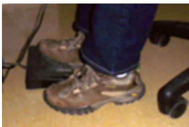
La pédale qui active l'écoute de l'enregistrement (19 x 15 cm), posée au sol ou sur un repose-pieds.