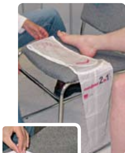
1A et B

> Sur une chaise , replier une partie de l'enfile-bas et y déposer le pied ( 1A ).