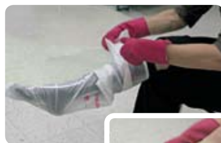
3A et B