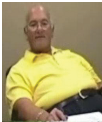
Soins des patients obèses (18 min 30 s)

Il existe plusieurs toiles glissantes avec des particularités distinctes. Cette vidéo présente comment utiliser la toile glissante Maximini.