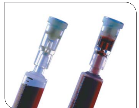
Dispositif d'élimination de bulle d'air Filter-Pro ® unique et breveté

Précision de l'héparine Portex TM dans l'analyse calcique lors de la comparaison de l'héparine sèche au Lithium, héparine de bas poids moléculaire et seringue non héparinée.