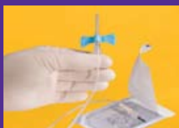
Tubulure sans mémoire : La tubulure ne s'enroule pas et ne se recourbe pas.

■ Aiguille en acier à ailettes ■ Aiguille pour prélèvement sanguin ■ Aiguille hypodermique ■ Autre ■ Verre